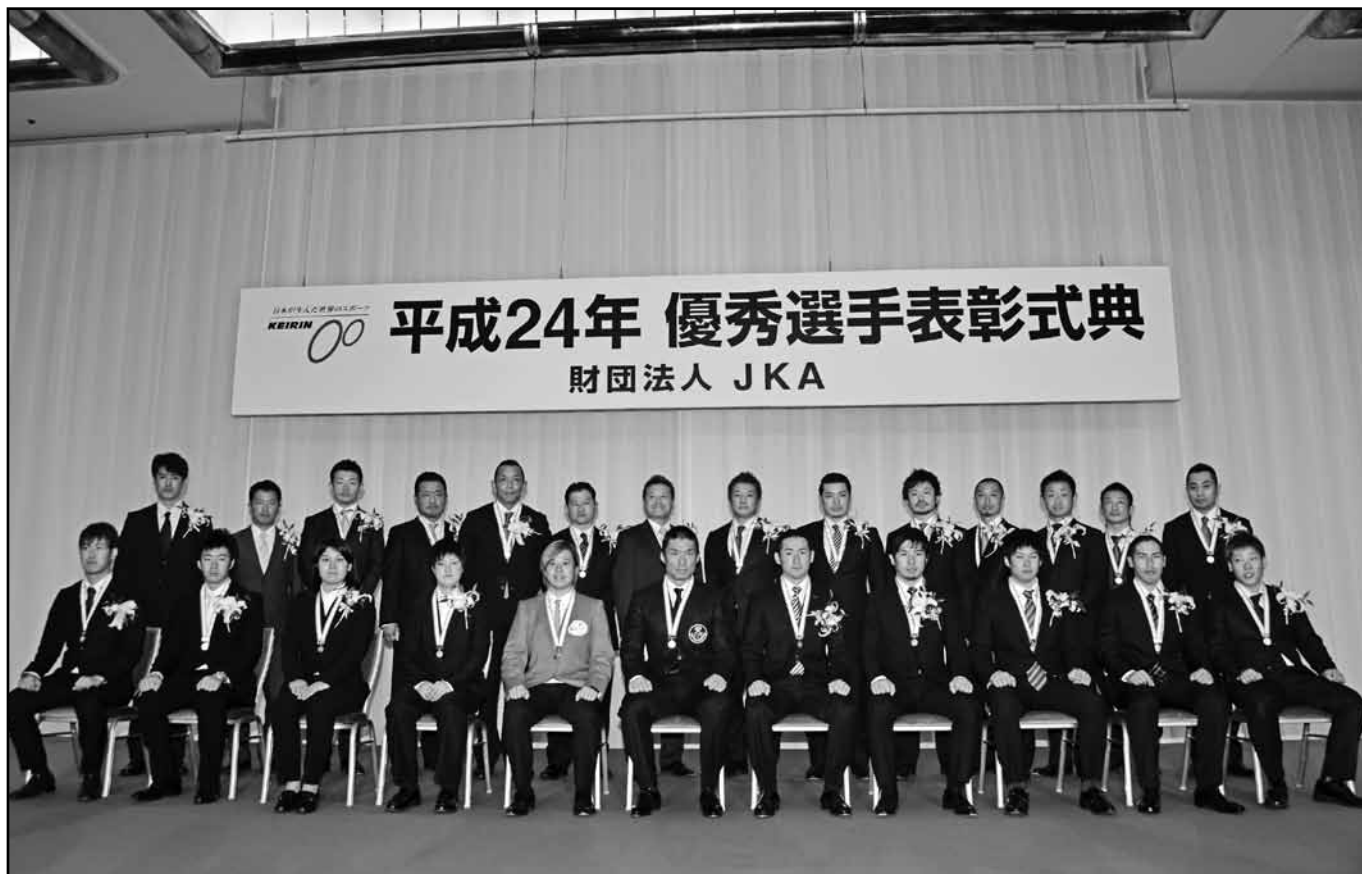
平成24年優秀選手表彰式典

発行 財団法人JKA 競輪広報部 東京都千代田区 六番町4番地6 電話03(3239)9420