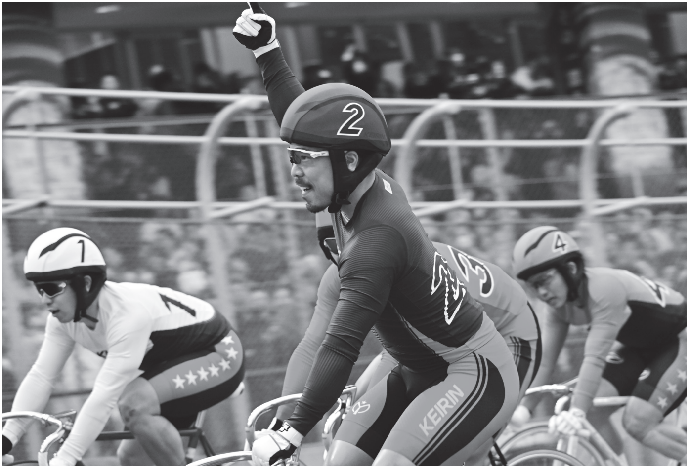
第80回日本選手権競輪優勝 古性優作選手(大阪)