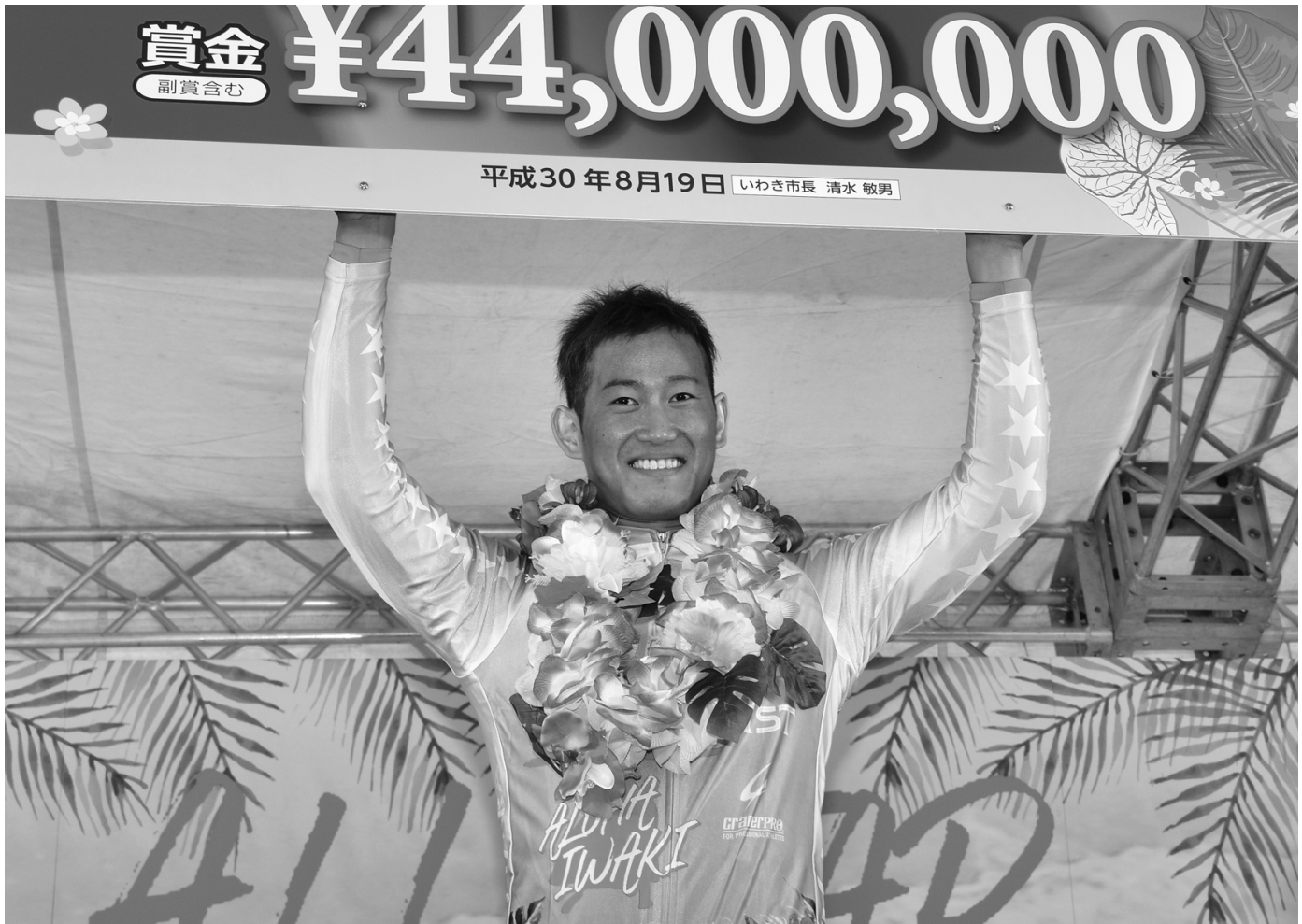
第61回オールスター競輪で優勝した脇本雄太選手