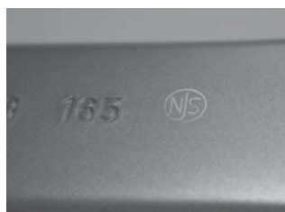
仕様変更後(レーザーマーキング)