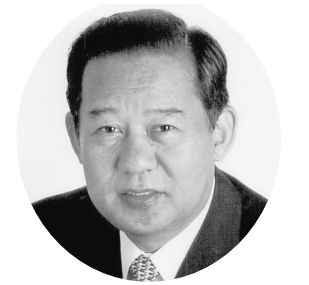
経済産業大臣 二階 俊博

平成21年の新春を迎え、謹んでお慶びを申し上げます。 昨年は、約2年ぶりに三度目の経済産業大臣の重職を担うこととなりました。