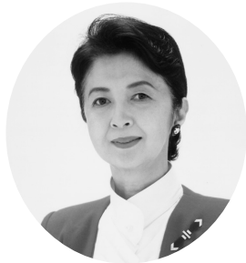
財団法人JKA 会長 下重 暁子

あけましておめでとうございます。 平素より皆様には競輪事業へのご支援、ご協力をいただき心からお礼申し上げます。