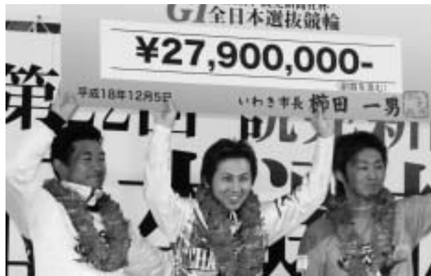
第22回全日本選抜競輪で優勝した合志正臣選手(中央)