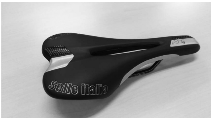
追加されるデザイン・色：白及び黒