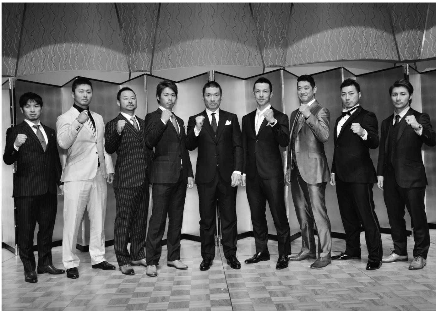
KEIRINグランプリ2015前夜祭 (於 グランドプリンスホテル新高輪)