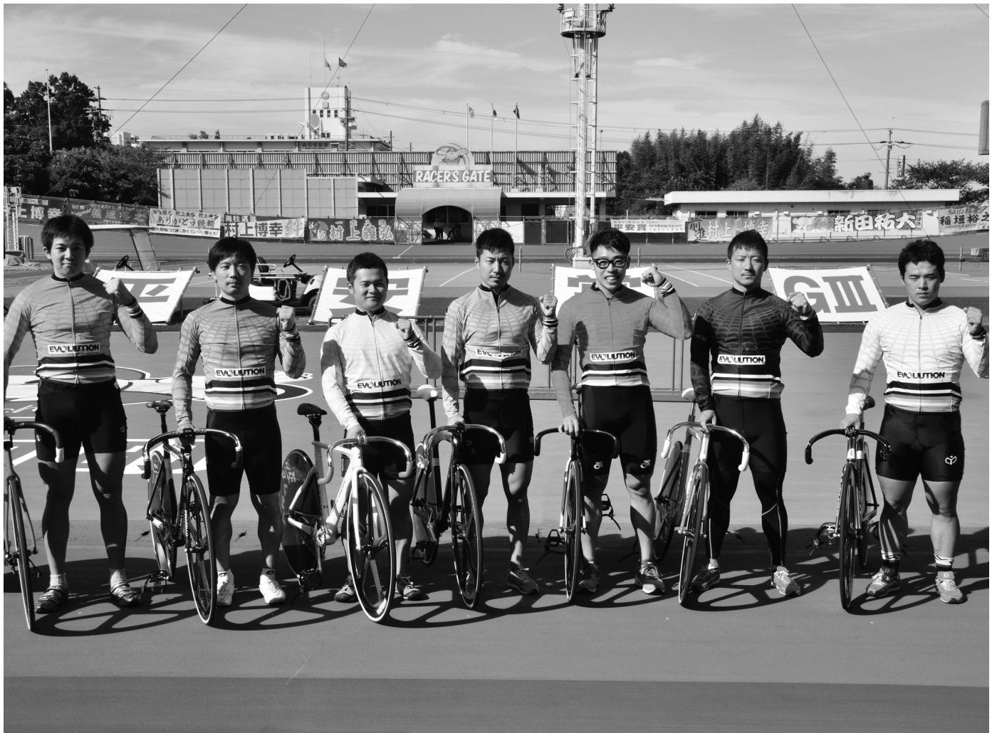
ケイリンエボリューション（向日町）出場選手