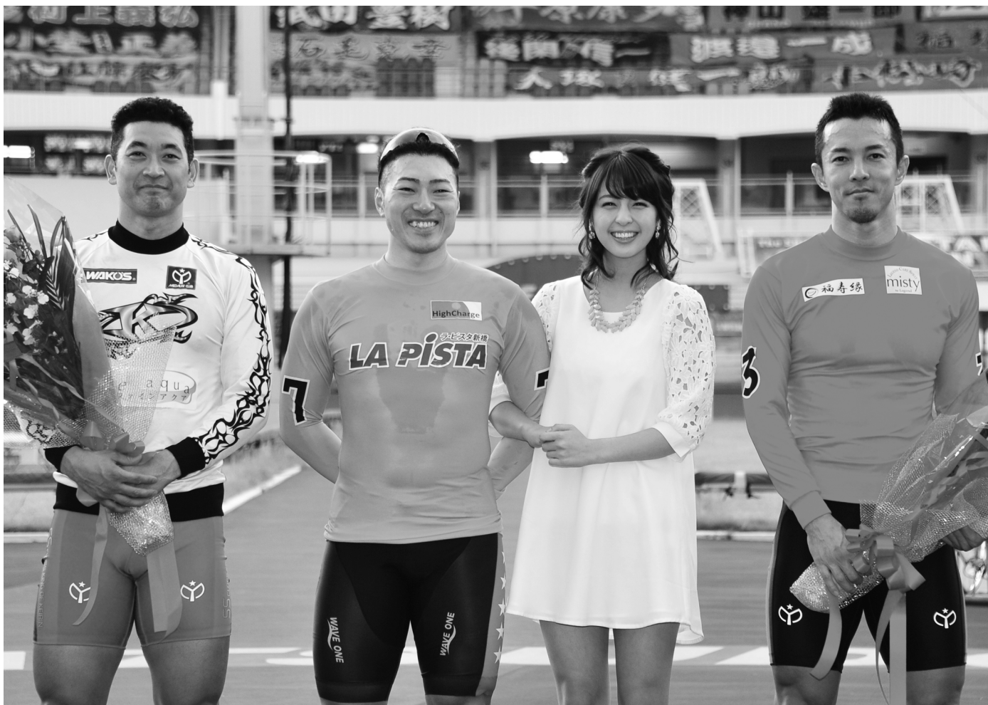
第58回オールスター競輪で優勝した新田祐大選手