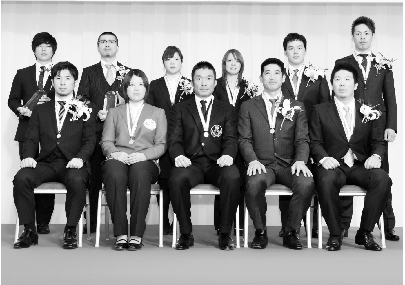
平成26年優秀選手表彰式典

発行 公益財団法人JKA 競輪広報部 東京都千代田区 六番町4番地6 電話 03(3239)9420