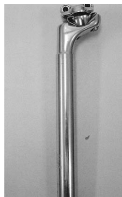
固定金具・シートピン